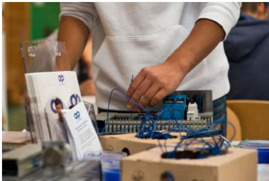
Mechatroniker/in Die Jugendlichen erproben den Beruf des/der Mechatroniker/in beim Verdrahten einer Baugruppe