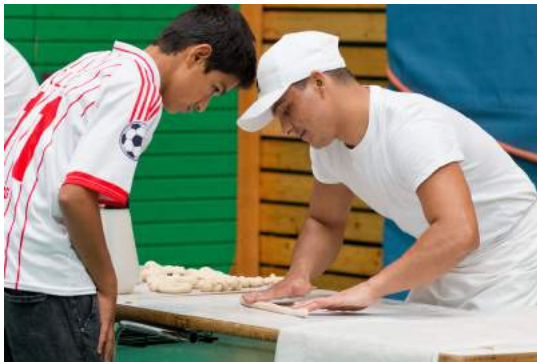
Bäcker/in Azubis leiten die Schüler/innen bei der Durchführung der Aufgabe an – hier beim Formen einer Breze