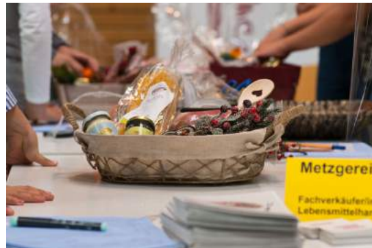
Fachverkäufer/in im Lebensmittelhandwerk Auch das Zusammenstellen von Präsentkörben zu bestimmten Themen und Anlässen ist Teil des Berufsbildes