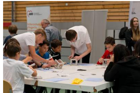
Werkzeugmechaniker/in Die Schüler/innen bauen einen Aluminiumwürfel zusammen und wieder auseinander