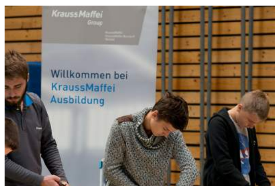
Unternehmensdarstellung Sie können ein Rollup-Display pro Station aufstellen (Werbe- fläche nicht über 1,5 m 2 )