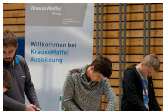
Unternehmensdarstellung Sie können ein Rollup-Display pro Station aufstellen (Werbe- fläche nicht über 1,5 m 2 )